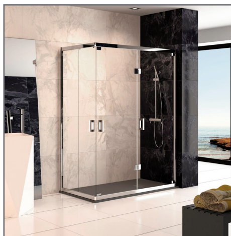
Elimina la cal de las mamparas sin atacar los metales del resto de instalaciones

Envases homologados de acuerdo con las directrices de la UE, para el envasado y almacenaje de Productos Químicos.